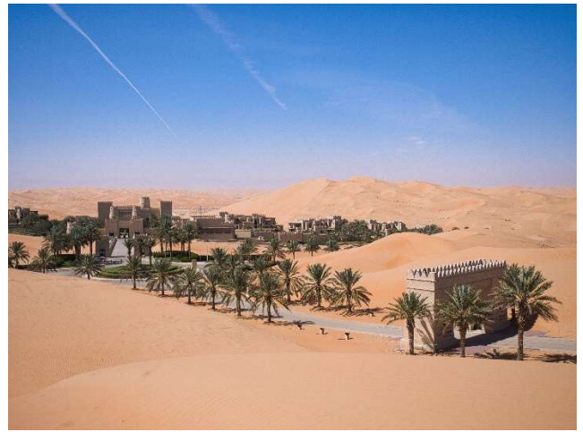
No.19、砂漠のリゾートホテル