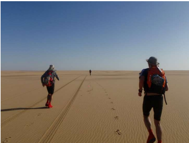
No.25、砂漠を走るランナー